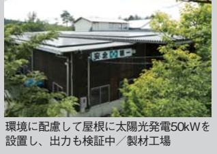
環境に配慮して屋根に太陽光発電50kWを設置し、出力も検証中/製材工場

東濃松の産地・中津川で材木店から出発した同社は、木の専門家として「本物の木の家づくり」を推進し、安心・健康・快適を追求している建築会社。一方で製材業・木材問屋でもあり、自社で材木の卸や製材も行い、他の業者を過ぎないことで良質な木材を安く仕入れることができる。そのメリットを活かし、上質な無垢材を使用したこだわりの家を、検討しやすい価格で提供しているのである。