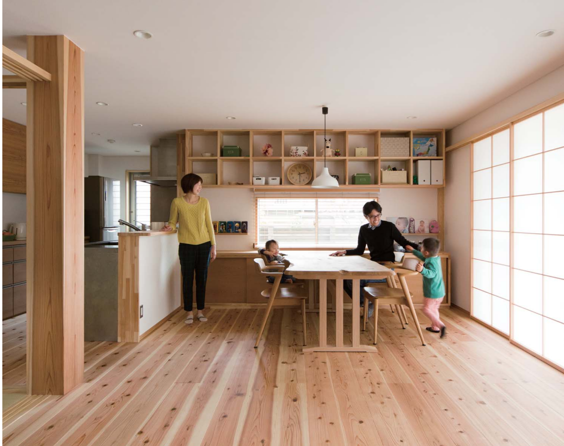
同社は基本、構造材は東濃産、大黒柱も桧を使用することが多いが、あえて杉を希望し、取り寄せてもらった杉の力強い大黒柱が印象的。造作のカウンターと棚が素敵なダイニング。カーテンではなく障子を設けたことで、やわらかい光を通し、和モダンな印象に（写真5点1邸）