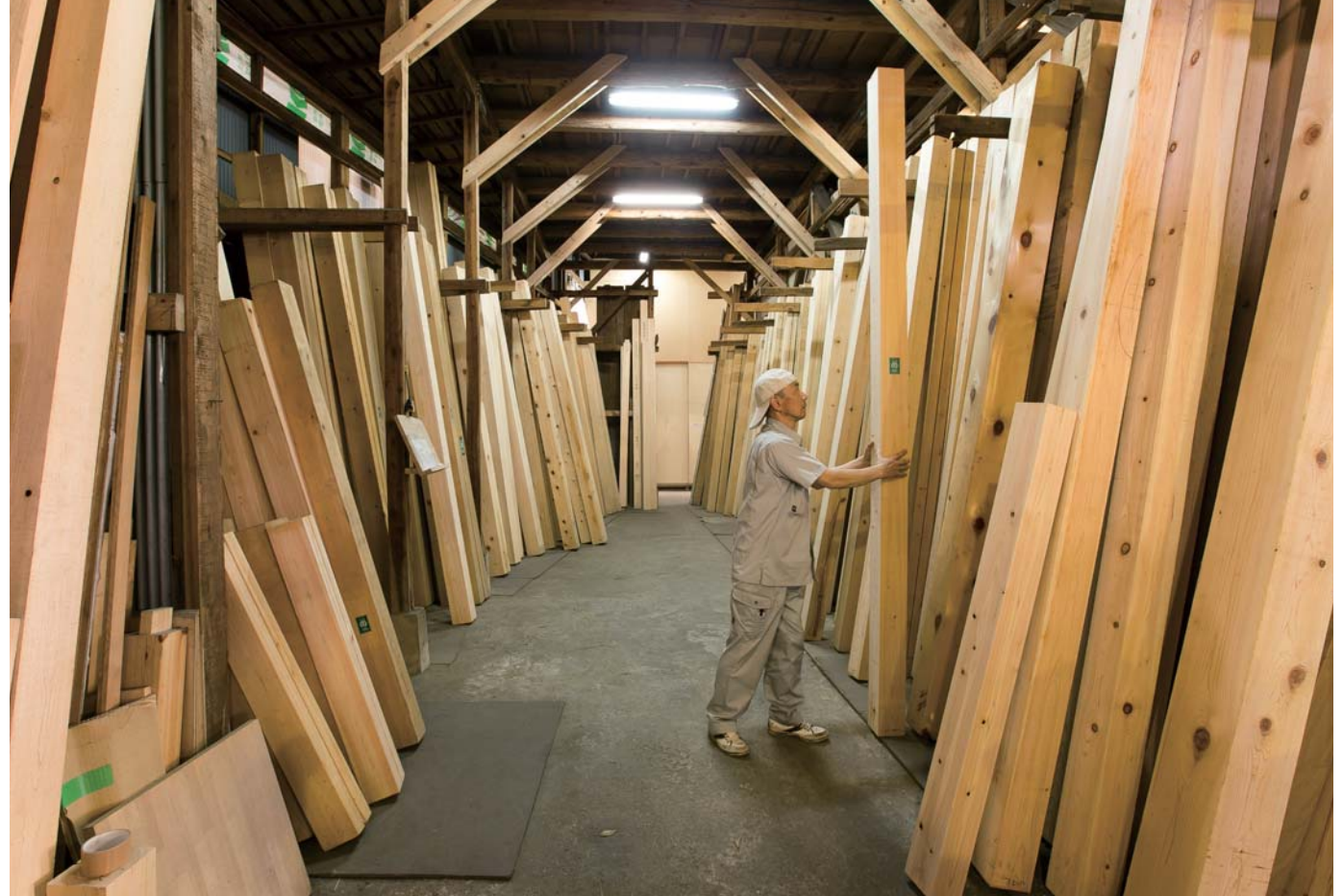
様々な木材が並び柱コーナー。同社の製材工場は木のいい香りとたくさんの木材に圧倒される。良質な木を見極め自社製材工場で卸や製材・加工を行うことで本物の木の家づくりを实践。他の業者を過ぎないことで全体のコストダウンを図っている。「見学会や工場見学で素材の良さを知ってもらった上で、家づくりのパートナーとして選んで頂けると嬉しいですね」とスタッフ