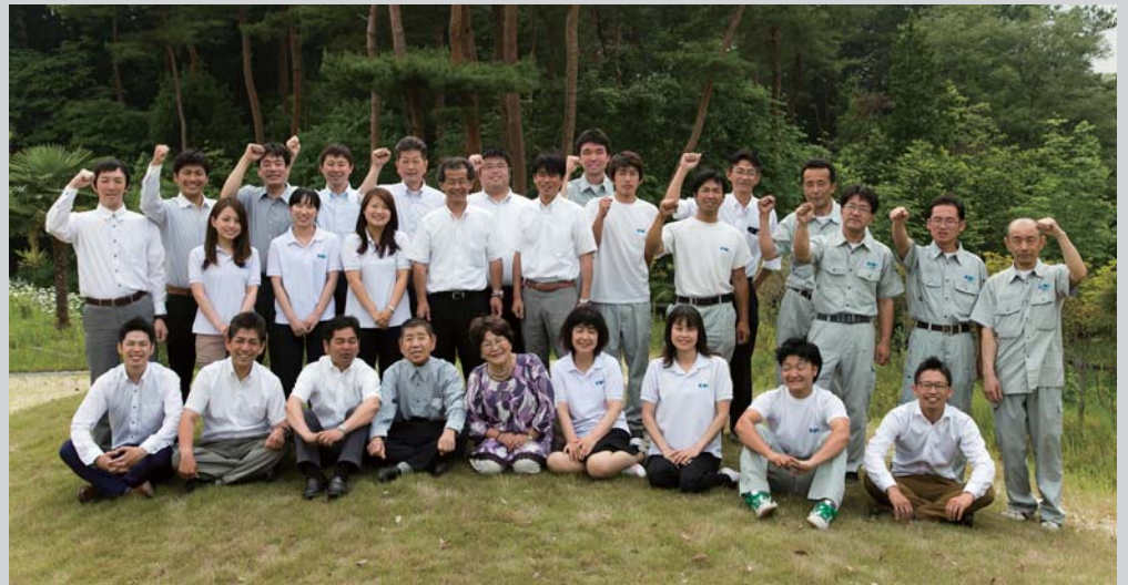
営業・設計・工務・製材・総務...それぞれのプロが一丸となって、施主の「楽しい家づくり」を丁寧にサポートしている