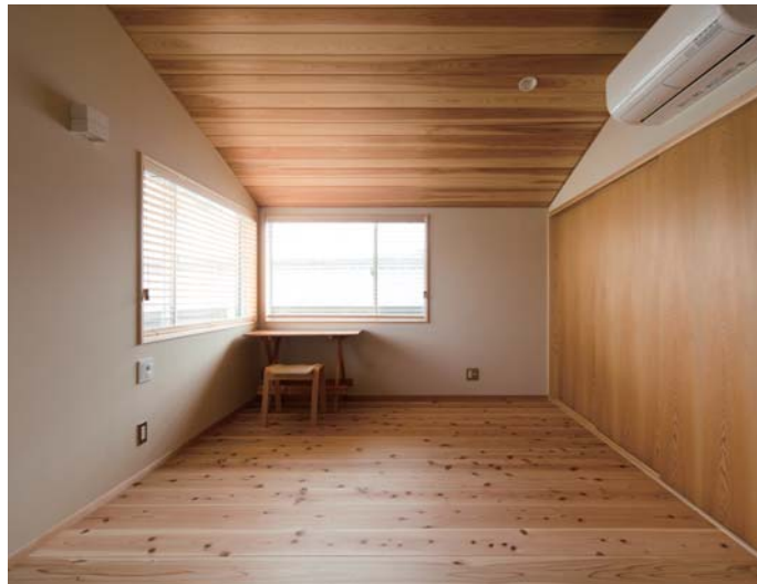
勾配天井の寝室。クローゼットの引き戸も造作で。天井も杉の羽目板で、心地よい眠りにつけそう。2階のホールから出入りするウォークインクローゼットも設けている