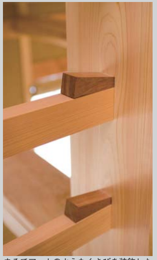
まるでアートのようなくさびを裝飾した手すり。細部まで丁寧 / 施工例