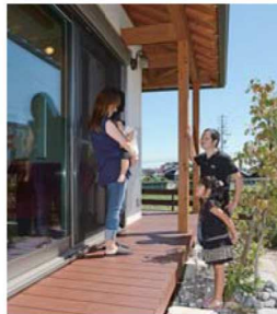
庭に面した濡縁で。「子どもがよくここで遊んでいます」