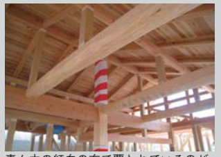
真ん中の紅白の布で覆われているのが、大黒柱（写真3点施工中写真）