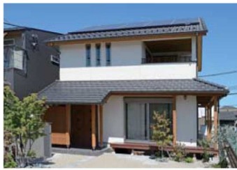
和モダンの外観。インナーバルコニーは、洗濯物を干すだけでなく、食事やお酒を飲んだりも