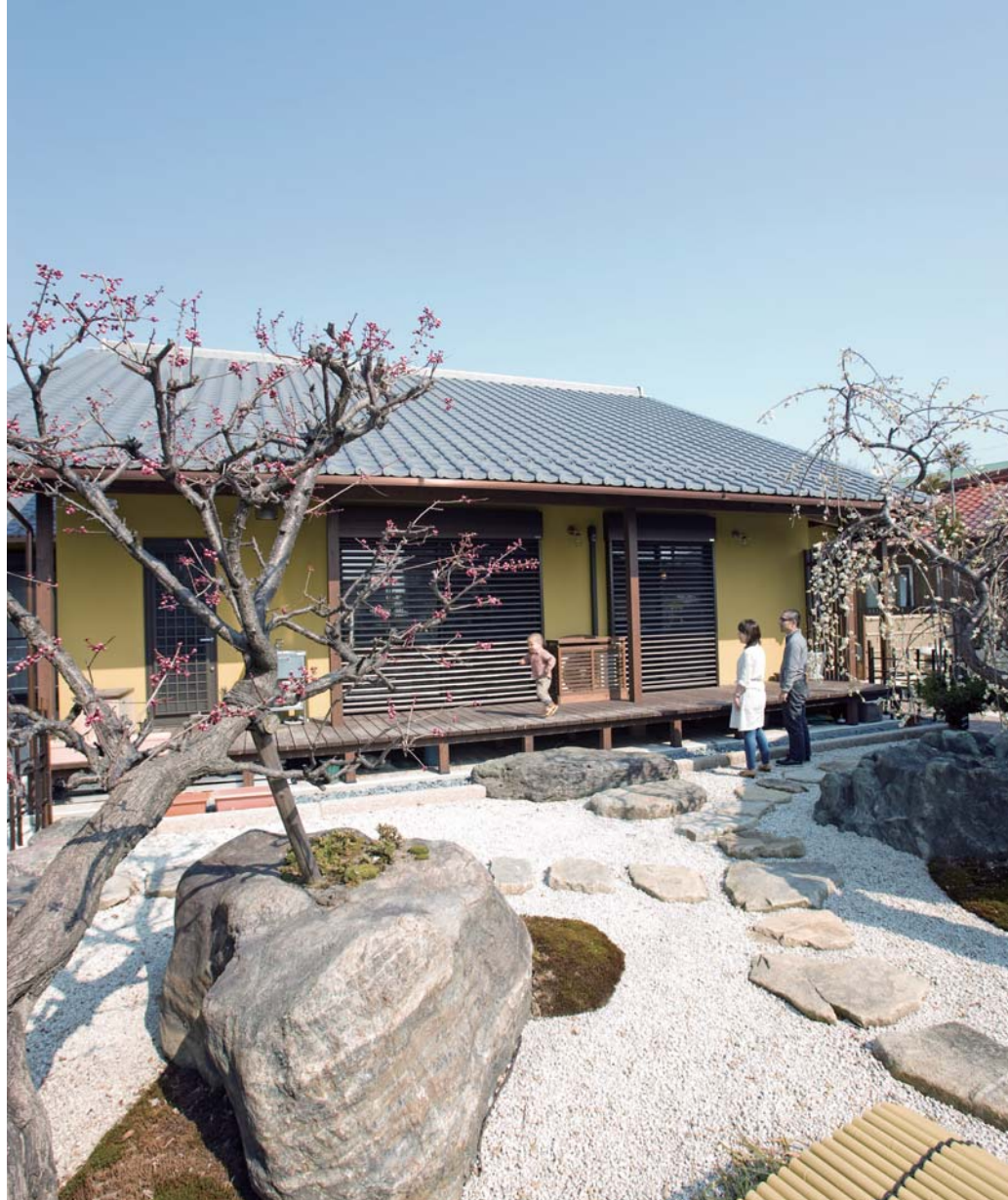
いぶし瓦に深い軒のある縁側、石が配されて梅が咲き誇る庭…古き良き日本の家屋を彷彿とさせる古民家風の1邸。からし色の外観は、スタッフの提案で実現した。広い庭や縁側は子どもにとっておきの遊び場。四季折々の表情を見せる庭を眺めながら縁側で飲むお茶は格別だろう