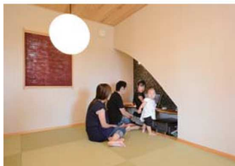
Rを描く壁がお洒落な和室。カウンターの一枚板は、あえて曲がったものを選んだのだそう