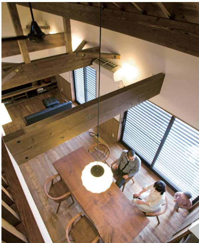
貫禄のある太い梁が見えるLDK。ダイニングセットは家具デザイナーを家に招き、この雰囲気合う一枚板の無垢材でオーダーし、サイズも質感もバッチリだ(このページの写真全て1邸)