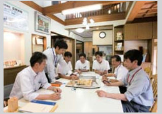
施主の要望以上の提案やアドバイスで、満足度を高める営業スタッフたち

一緒に創り上げていくかが重要です」と、同社社長。 創業当初から、「自分の家を建てるような気持ちで携わり、完成してからが本当のお付き合い」を合言葉にしている同社。より良い家になるように提案やアドバイスをしてくれ、親身になってサポートしてくれる心強い「スタッフ」も大きな魅力である。