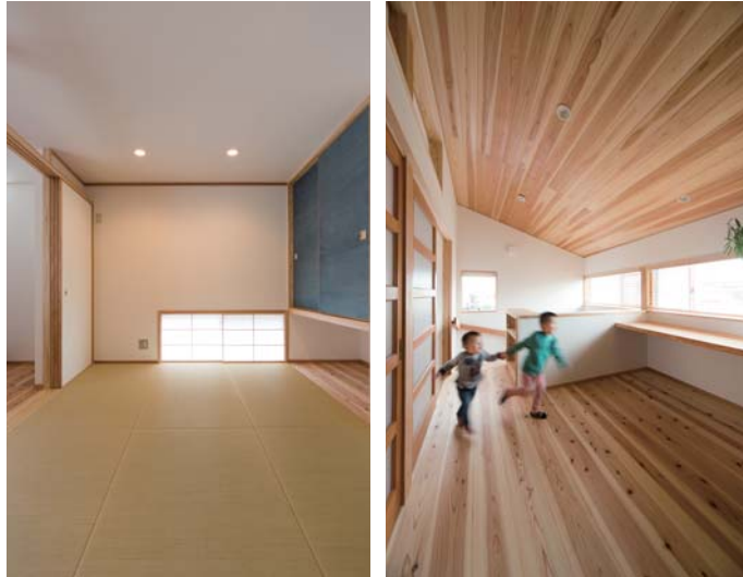
リビングの続き間になる和室は襖を閉めれば子ども部屋の前にはワークスペースが。このカウンターも、工場で選んだ杉の一枚板だ