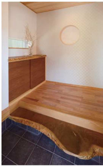
玄関の式台や下駄箱の天板に使われている味のある板は、工場で吟味。丸窓も実現