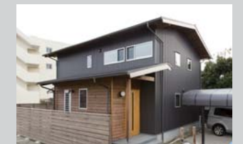
ガルバリウムの外壁に錆貼りの杉板、松の玄関ドアがぬくもりを添えている

ので、どれもぴったりで統一感があり、素敵な空間になりましたね。1さんは、たくさんのこだわりをお持ちで、私も大変勉強になりました。ご家族が楽しそうに暮らしているのを拝見して、私も嬉しいです。