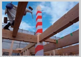
熟練大工の匠の技や、丁寧な手仕事も同社の大きな強み

同社は、完成してからでは見ることのできない「構造」にも強いこだわりをもっている。同社が厳選した「素材」や素材を活かす技術、地震に強い構造を確認してみたい。また、実際に建ててくれる大工の人柄、仕事ぶりなども確認できるので、安心感も得られる。見学希望の方は気軽に問い合わせを。