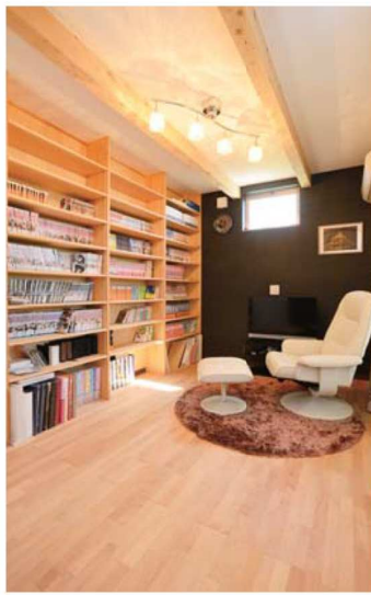
「壁一面の本棚が夢だった」というTさん。読書に没頭できる素敵な書齋が実現した