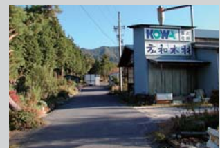
広大な森の緑に包まれた本社・製材工場

■小牧支店 アクセス/名鉄小牧線小牧駅より徒歩6分 問合せ/0568-41-3950