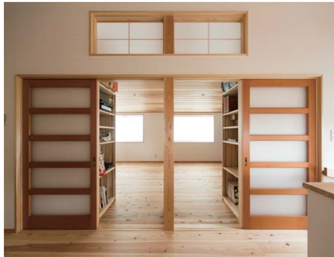
左右対称になった子ども部屋は、将来2部屋に間仕切りができるよう設計されている。子どもが小さいうちは勾配天井になった広い空間でのびのび遊べる。欄間の障子も造作している