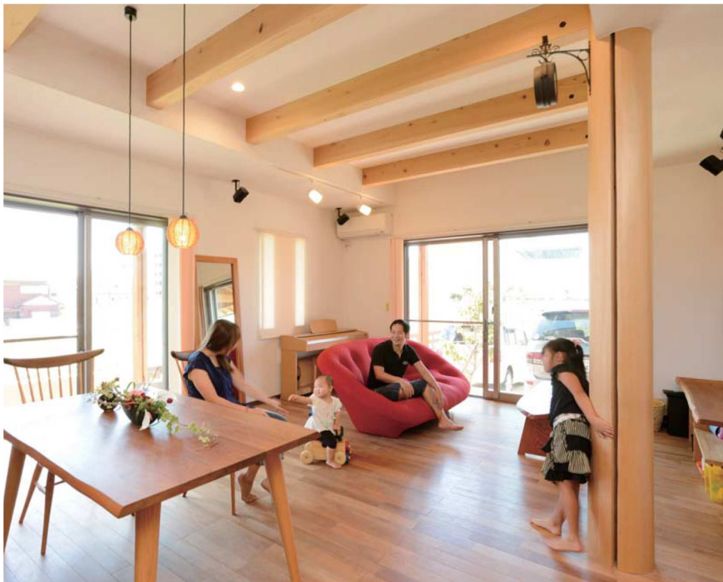
大工さんがつくる木の家に憧れ、木に囲まれた暮らしを希望していたTさん。どっしりとした大黒柱は願った丸柱を希望し、天井の梁や水目桜の無垢材を採用した床など、希望を叶えたTさん家族。テレビ台やテーブル、カウンターの天板は、同社の工場を選び、愛着のわく住まいとなった