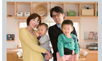
「友達を呼んで、ホームパーティも楽しんでいますよ」と1さん家族

凝り性だという1さんは、家づくりにあたり、素材などをイチから勉強し、分からないことはすぐ調べて資料を作成していたほど。そうして、夫婦2人の意見をまとめ、要望を広和木材のスタッフに伝えて図面に。そこから何度かやり取りをして、プランを練っていたそう。