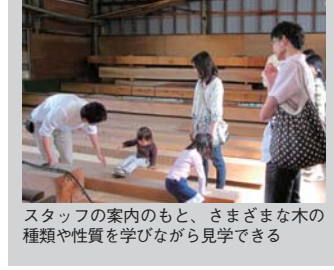
スタッフの案内のもと、さまざまな木の種類や性質を学びながら見学できる

製材工場専門スタッフが案内する「工場見学」を随時開催（要事前予約）。木についての知識を深めながら、実際に木に触れたり、香りを嗅いだりすることで、やすらぎや癒しを実感し、住まいに木を取り入れた建築をする方が多いと言う。興味のある方はぜひ問い合わせの上、訪れてみよう！