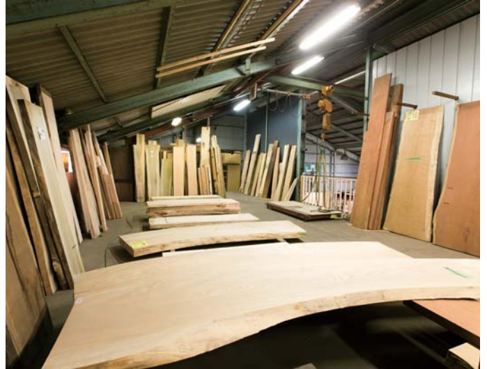
ここではテーブルやカウンターの天板などに使われる一枚板のストックがいっぱい。自分たちが暮らす場所の木材を選ぶのも、同社ならではの体験だろう