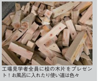
工場見学者全員に松の木片をプレゼント！お風呂に入れたり使い道は色々