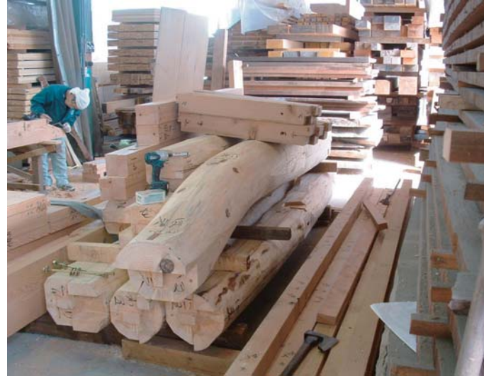
様々な種類や大きさの木材がストックされ、注文の寸法に製材している製材加工場。工場見学では、適材適所での木材の使い方などを学ぶことができる ※写真すべて同社製材工場