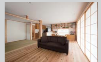
あえて天井高を低めにしたことで、横の広がりや落ち着き感が感じられるLDK

1邸を担当した同社の石川さん(右写真)にお話を伺うと、「1さんは、雑誌などで、リビングはこんな感じ、キッチンはこちら、子ども部屋はこう…と、それぞれの部屋のイメージが分かる写真をファイルにまとめてくださっていたので、こちらもイメージを掴みやすかったです。戸や障子、棚やキッチン