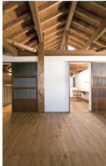
以前の家で使っていた戸を、スタッフの提案で再利用することに。いい味を出している