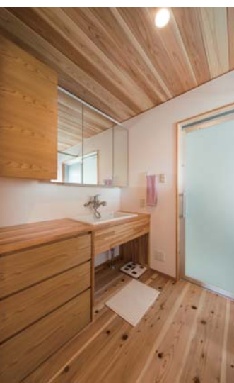
洗面化粧台や収納も同社の造作。コンセントやスイッチなど細かい所までこだわっている