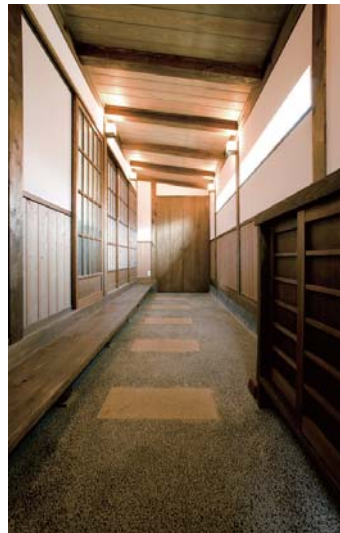
和情緒あふれる通り土間。右手は造りつけの下駄箱で、式台の木材は製材工場を選んだ