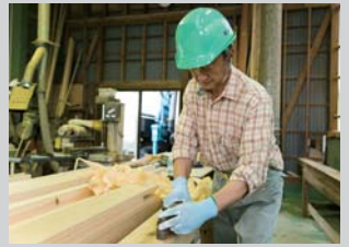
実際の住まいのどの部分に使われるかを想定しながら、丹精込めて仕上げる