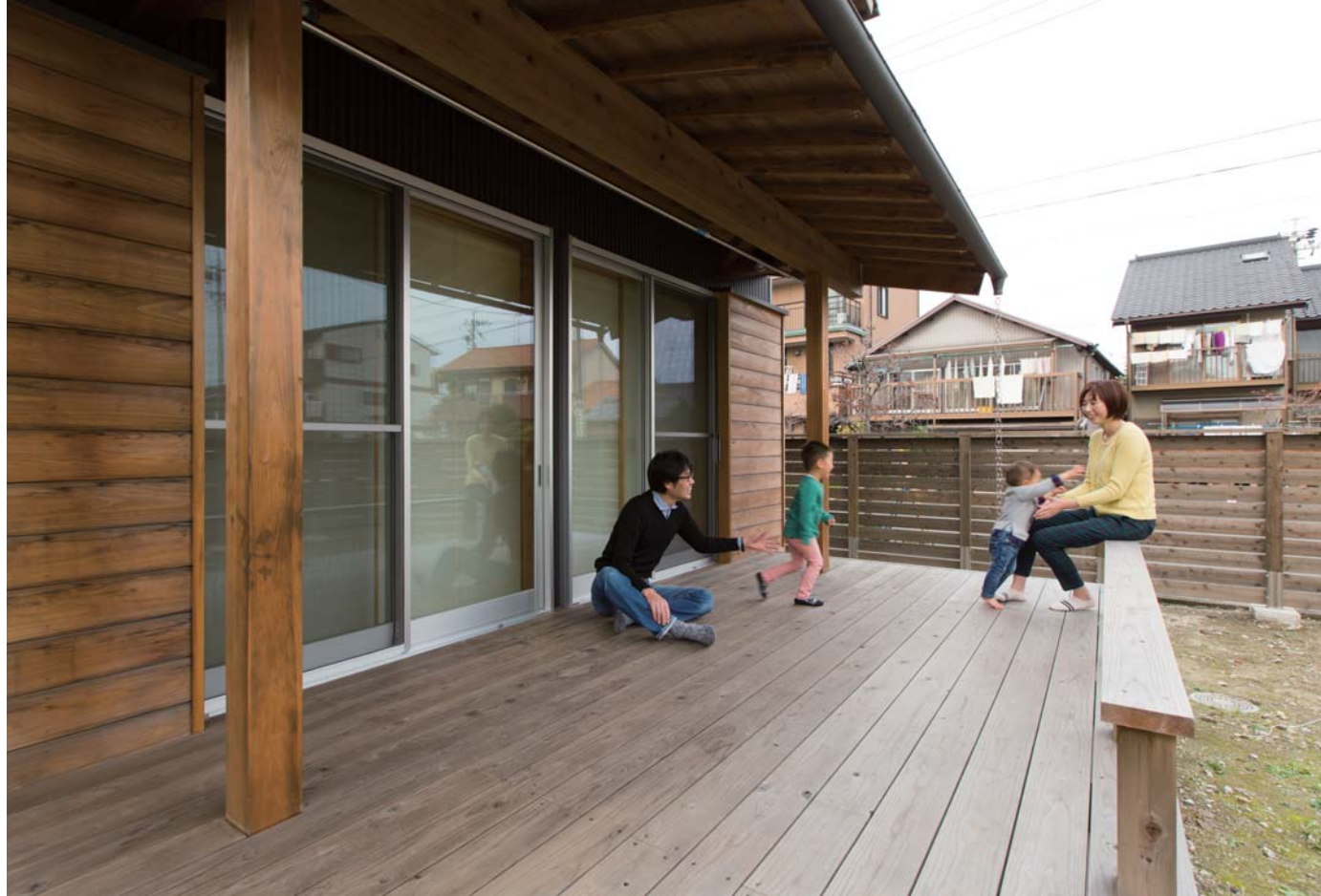
室内と庭をつなぐ広いウッドデッキは、深い軒がかり、少しの雨なら洗濯物を干しても大丈夫そう。洗濯物を干すスペースとしてだけでなく、子どもの楽しい遊び場や、ピクニック気分ランチを楽しんだり、バーベキューなどにも大活躍しそう。これから庭のお手入れも楽しくなりそう！(このページの写真すべて1邸)