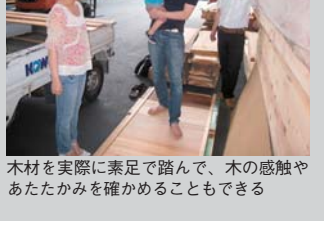
木材を実際に素足で踏んで、木の感触やあたたかみを確かめることもできる